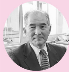
涌谷町農業委員会 会長