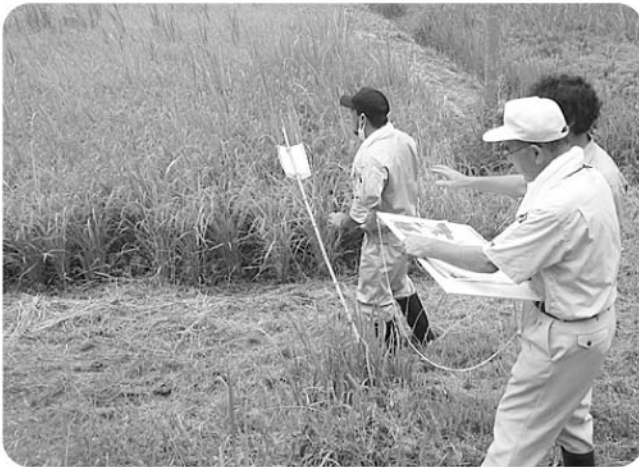
農地パトロールの様子