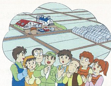
地域みんなで農地を守っていきましょう