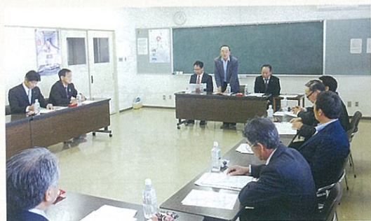
福島県猪苗代町農業委員会での視察風景

加美町との相違点は、農地利用最適化推進委員が、担当する区域である農地の権利移動や転用許可申請があった事案について、農業委員と共に現地調査を行い、総会で議決権こそないが、調査結果を報告するという事でした。