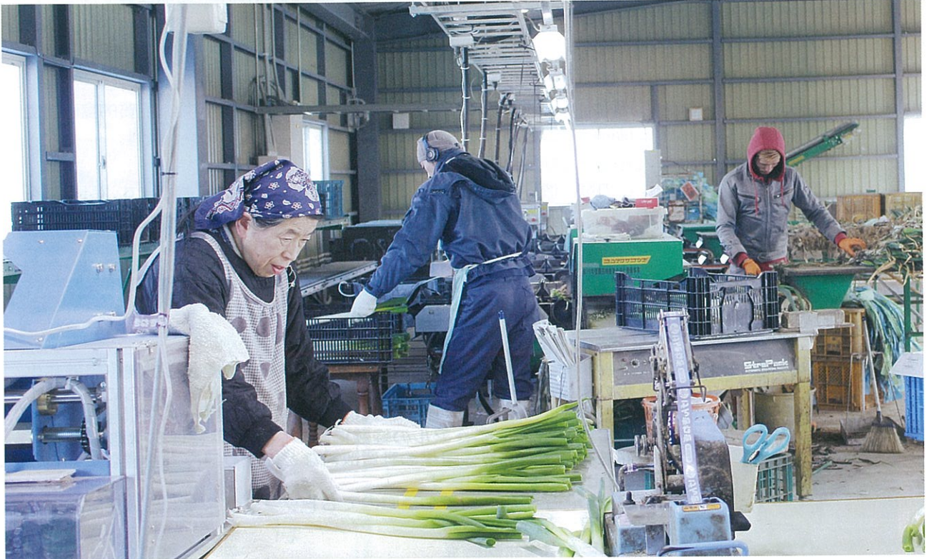
機械化によるネギの出荷調製作業の様子

加美町農業委員会 加美町字長檀75番地2 ☎0229-67-5411 第26号 令和2年3月発行