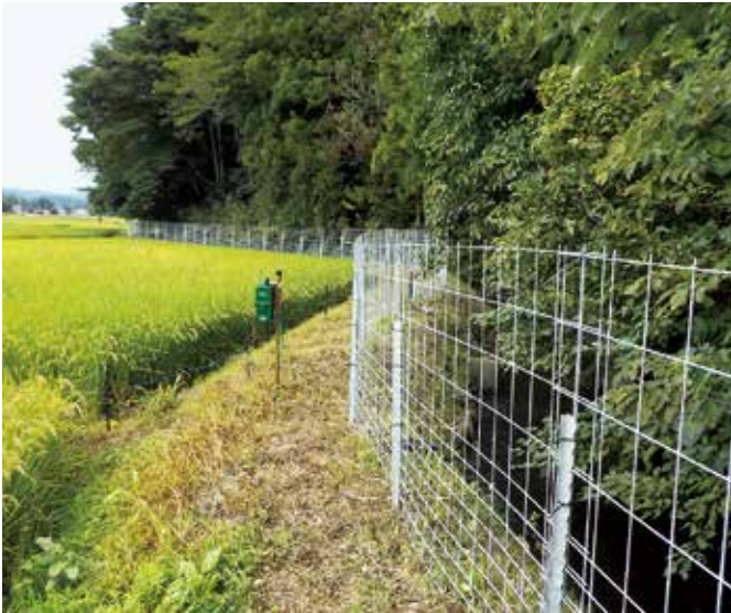
設置されたワイヤーメッシュ