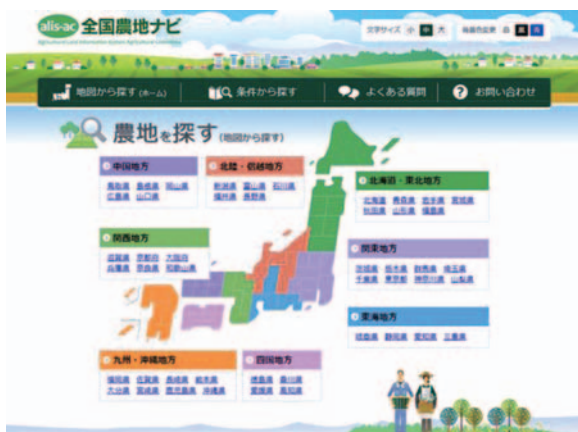
【全国農地ナビ http://www.alis-ac.jp/ 】