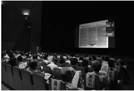
市町村農業委員・農地利用最適化推進委員研修会

8月28日「市町村農業委員・農地利用最適化推進委員新任者研修会」を大和町まほろばホールで開催し約150名の参加がありました。今年7月の改選で初めて委員となった参加者に対し、農業委員会制度の変遷をはじめ、農地法など、農業委員会の業務に必要な基礎的な研修が行われました。