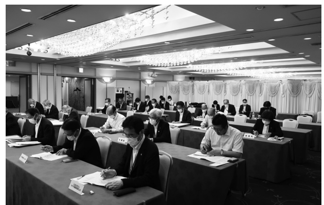
第8回通常総会の協議の様様

化活動の目標設定を支援するとともに、県内31農業委員会に導入されたタブレット端末について、農業委員や最適化推進委員等を対象とした操作研修会を行いました。また、令和4年7月15日からの記録的な大雨に関し、宮城県農業法人協会等と連名で「大雨による農業関係被害への支援に関する要望書」を県知事に提出したほか、ウクライナ情勢や急激な円安の進行による資材高騰対策についても、県知事への「農地等の利用の最適化に関する意見」提出の中で併せて要望しました。