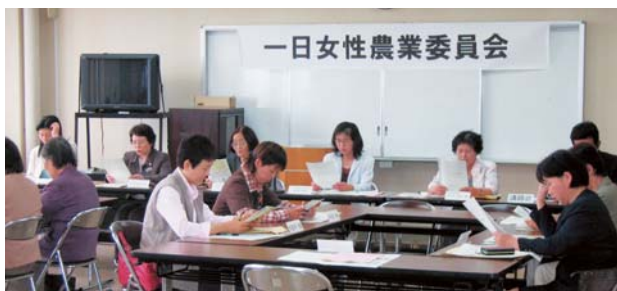
一日女性農業委員会

大崎市西部農業委員会では、農業者の公的代表機関として地元農業者の期待と信頼に応えるために、施策の検討や関係機関への建議・要望や意見の公表等に向け、農業委員会活動を今後一層強化することが必要と考えています。